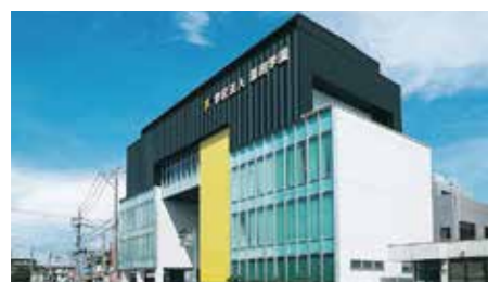
鹿兒島醫療技術專門學校 谷山校區