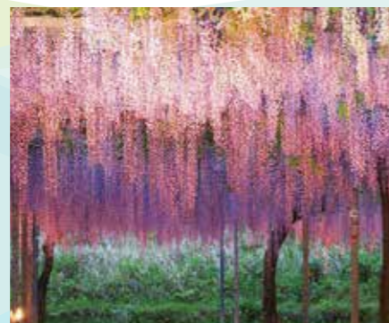
和氣公園 紫藤花祭