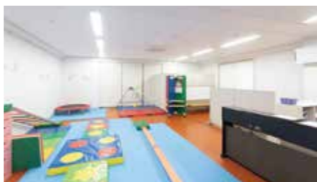
孩童・育兒支援中心SHIRAYUKI