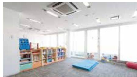
原田學園語言支援中心