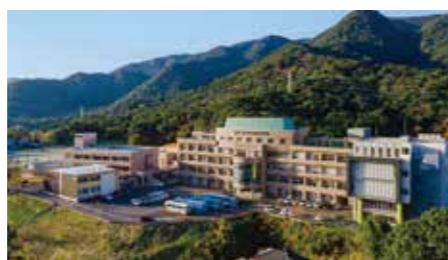
鹿兒島醫療技術專門學校 平川校區