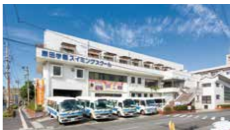
原田學園游泳學校