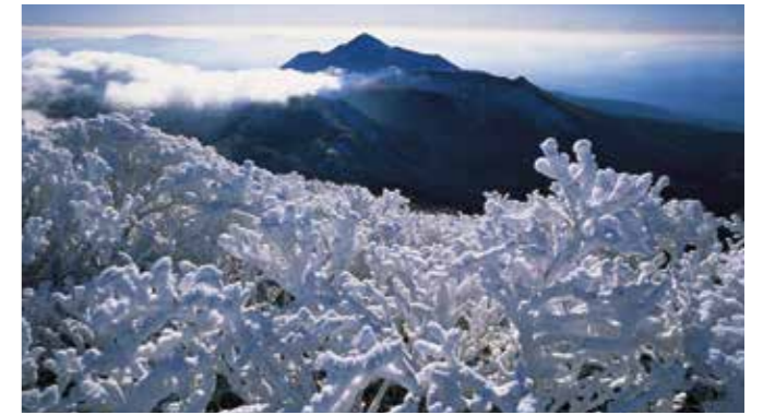
霧島連山冬天景色